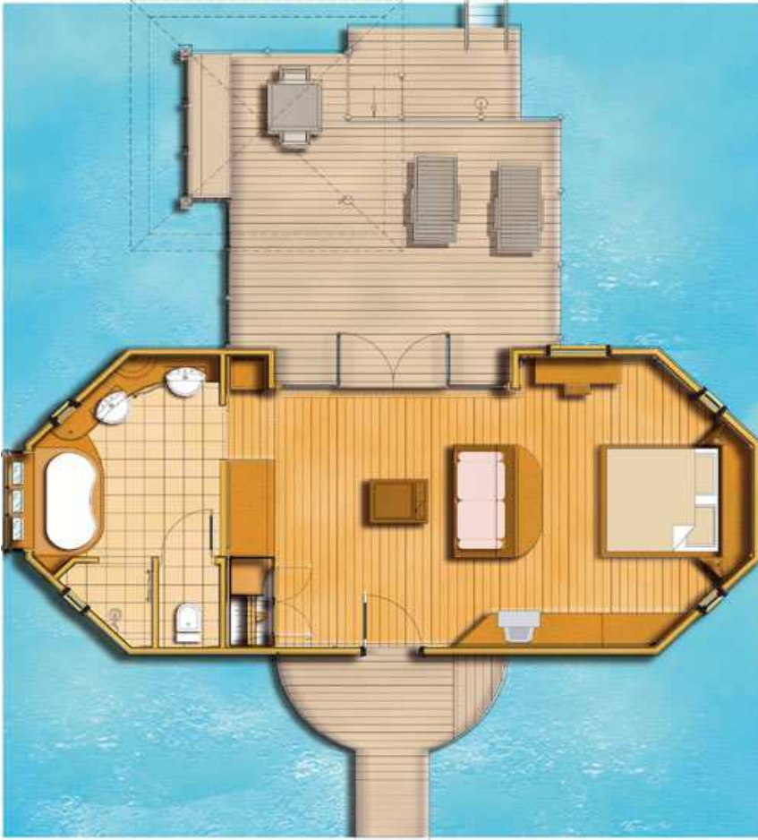
Overwater Suite/Suite Pilotis