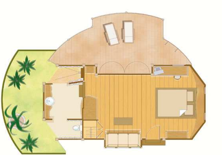
Beach Bungalow/Bungalow Plage